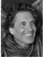
Jef Gianadda Emergence 200 x 100 cm