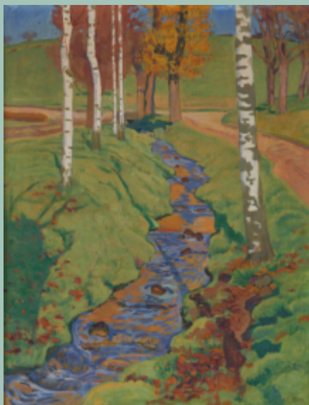
Edouard Boss : Ruisseau huile sur papier marouflé sur toile 24 x 48 cm Collection privée