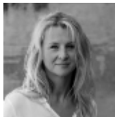
Pavlina En elle 115 x 80 cm