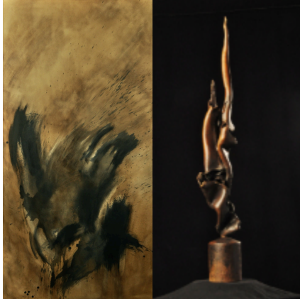
Transfiguration 78.5 x 18 cm bronze